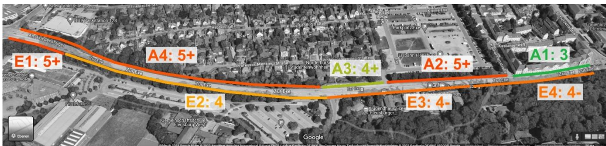
Abb. 3: Benotung der Abschnitte (Fake-Wert = 0).

Nach der Bewertung durch die Fußgänger und Radfahrenden werden die Abschnitte A2, A4 und E1 am schlechtesten bewertet. Was diese Abschnitte vereint ist eine sehr geringe Breite sowie der kombinierte Verkehr, der zu vielen Konflikten führt.